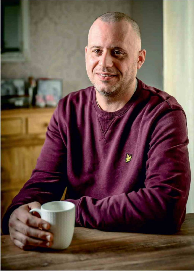
Wim: 'Ik had een hoop schulden, leningen en kredietkaarten waar mijn vriendin niets van wist. Een gokverslaving verbergen is een doodvermoeiende bezigheid.'

loren had. Als ik vandaag kijk naar foto's uit die jaren, zie ik een getrokken, bleke man. En de lach is nooit oprecht.