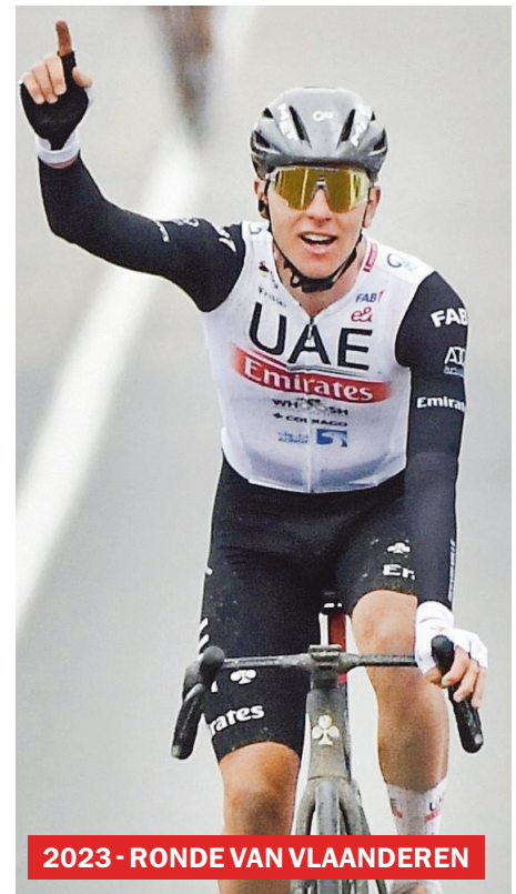
2023 - RONDE VAN VLAANDEREN

2 à 3 km/u sneller dan Van Aert op Oude Kwaremont