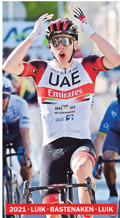
2021 - LUIK - BASTENAKEN - LUIK

Eddy Merckx keek vol bewondering naar de prestaties van Tadej Pogacar. De wielrenner van UAE won na een dominante prestatie de Ronde. «Het was één van de mooiste edities. De drie favorieten zaten met Pedersen vooraan. Pogacar reed iedereen uit het wiel op de Oude Kwaremont en hield stand op de Paterberg. Als je ziet dat Mathieu van der Poel met 400 Watt naar de aankomst reed, kan de prestatie van Pogacar zeer hoog ingeschat worden.» Waar vreugde is, is verdriet. Of teleurstelling in dit geval. Wout van Aert moest vrede nemen met een vierde plek. «Hij kwam een beetje tekort. Ik hoop één ding: dat hij zondag de beste is en Parijs-Roubaix wint. Je mag Van Aert zeker niet afschrijven als je ziet hoe hij Gent-Wevelgem rijdt.» Remco Evenepoel bewees in andere eendagskoersen al dat hij het ook kan. Merckx hoopt hem ooit de Ronde van Vlaanderen te zien rijden: «Hij heeft de Ronde van Spanje gewonnen en werd wereldkampioen. Hopelijk wint hij ooit ook de Ronde van Vlaanderen en de Tour. Als hij aan de start komt, is het om te winnen.»