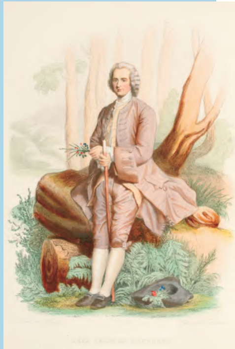
J.-J. Rousseaus Confessions (1784) verscheen pas na zijn dood.