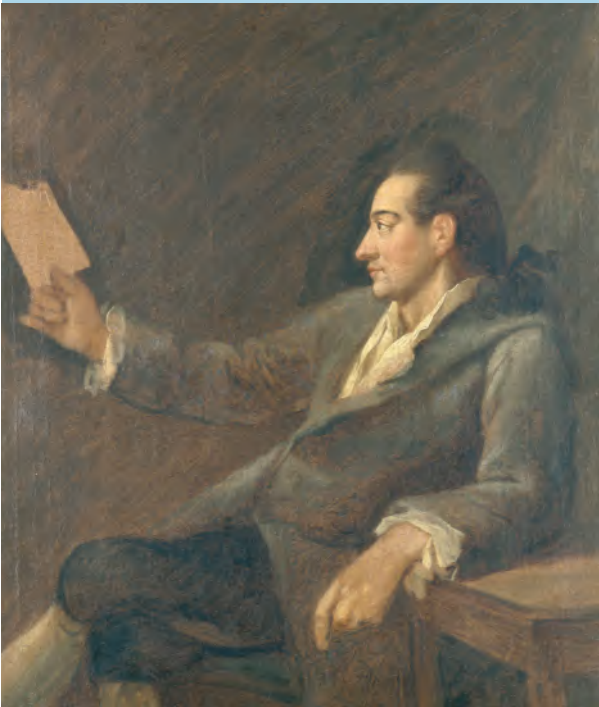
Met Dichtung und Wahrheit schreef J.W. von Goethe een autobiografie.

Het schrijven van geschiedenis vanuit een zelfbeleefde visie op de werkelijkheid, met de eigen persoon en diens ontwikkelingsgang als referentiepunt is eeuwenoud. Aan het begin van een christelijke Westerse traditie staan de 'Confessiones' (letterlijk: 'bekentenissen') van de kerkvader, bisschop van Hippo, de heilige Augustinus (354-430). Ook de middeleeuwen hebben vanaf de 'renaissance' van de 12 de eeuw met figuren als Abelard, Suger van Saint-Denis en vooral Guibert van Nogent (1053/1064-ca.1125) met zijn 'De vita sua' de traditie verder gezet. In de late middeleeuwen zullen ook vorsten en stedelingen in steeds toenemende mate 'egodocumenten' produceren. Het is dus niet, zoals vaak in de literatuur wordt aangegeven, wachten op de renaissance van de 15 de -16 de eeuw vooraleer het individu als ordenend en zingevend element naar voren wordt geschoven. Toch bleef het egodocument tijdens de hoogdagen van het wetenschappelijk positivisme verdacht en werd het amper au sérieux genomen.